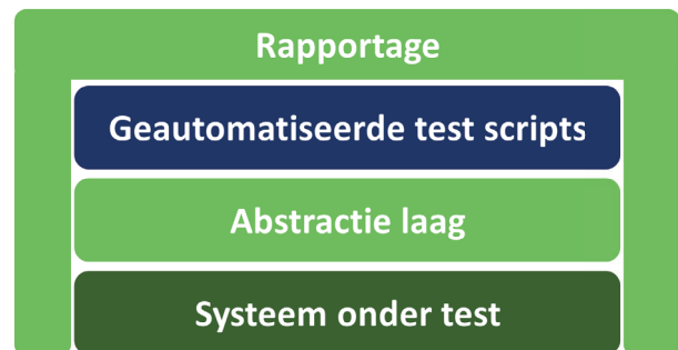
Schematische weergave van testautomatisering